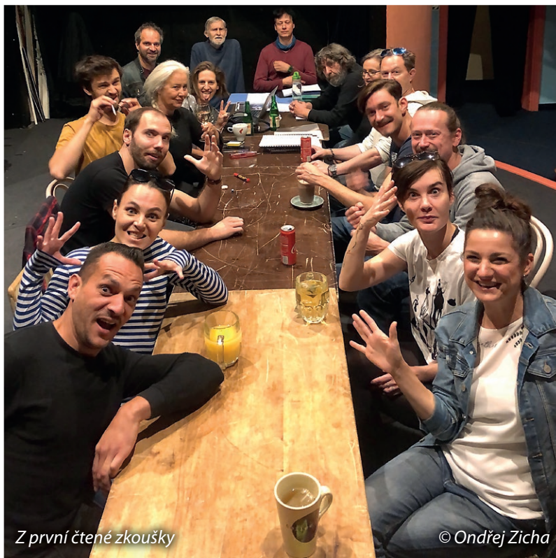
Z první čtené zkoušky

„Amor je dítě, co si rádo hraje, a proto láska vždycky bláznivá je.“ (W. S.)