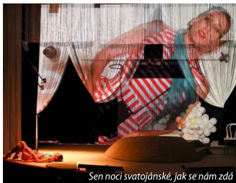
Sen noci svatojánské, jak se nám zdá

berte tuto mou poznámku jako pozvánku do jakéhokoli divadla. Jelikož právě divadlo vytváří (dnes o to víc) v dusné a nesouřadné době společenství lidí, které mnohé spojuje, umí nabíjet