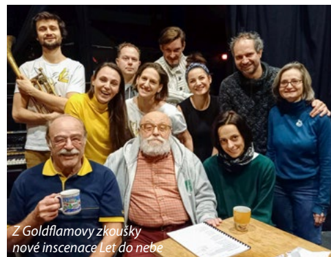
Z Goldflamovy zkoušky nové inscenace Let do nebe

Ředitel a umělecký šéf legendárního pražského divadla Studio Ypsilon. Výrazná osobnost české kulturní scény, k jejímuž jménu se váže hned několik uměleckých profesí – režisér, dramatik, spisovatel, výtvarník, pedagog a také herec.