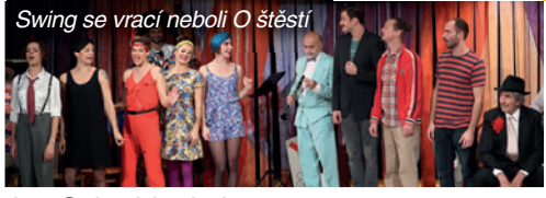
Swing se vrací neboli O štěstí