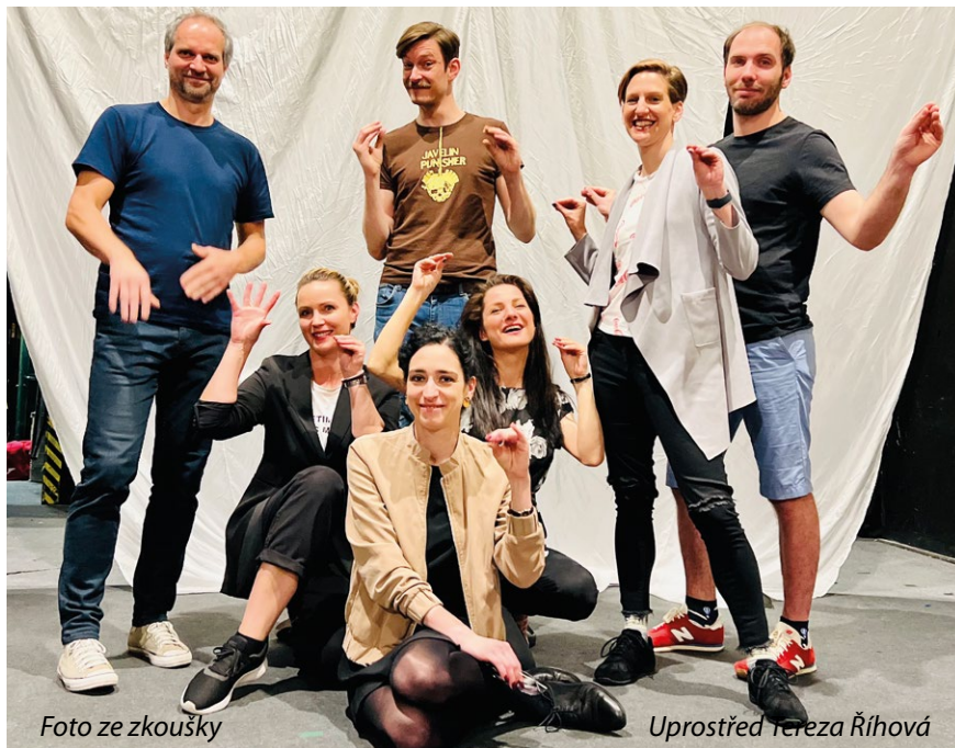
Foto ze zkoušky

Text Rolanda Schimmelpfenniga rozvíjí téma vzpomínek na mládí, na vztahy, které časem zanikly a na životní cesty, po kterých jsme se nevydali. Titulní „černá voda“ je metaforou minulosti, kterou nelze pořádně uchopit, ke které se nelze dostat a jejíž mihotání je na jednu stranu lákavé a na stranu druhou zavádějící.