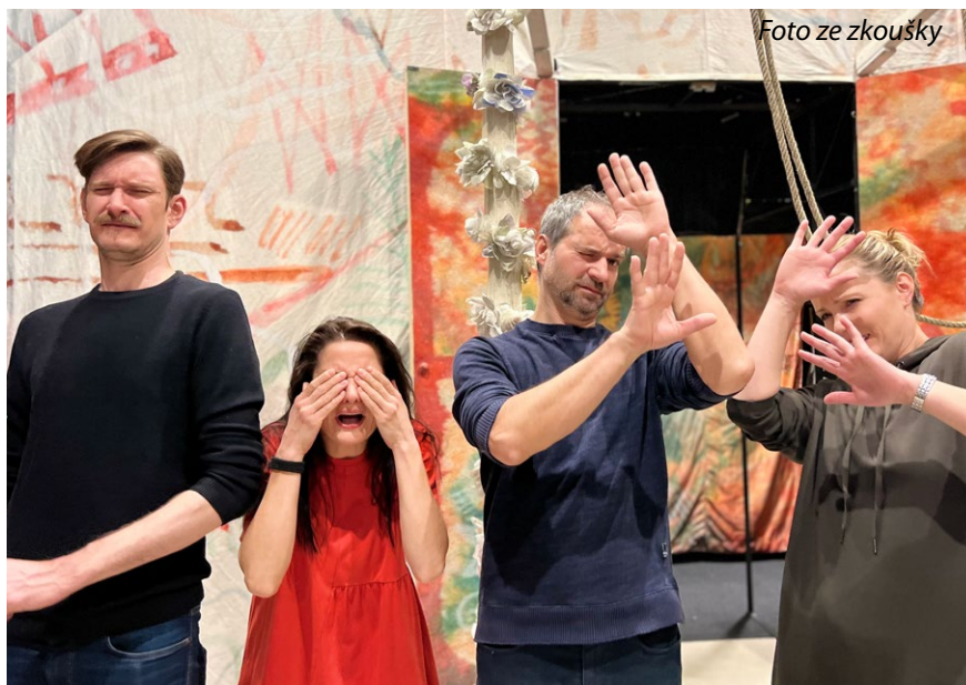
Foto ze zkoušky