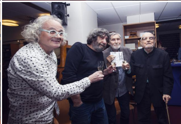
Fotografie ze křtu

Hlavním mediálním partnerem 55 let Ypsilonu je Český rozhlas.